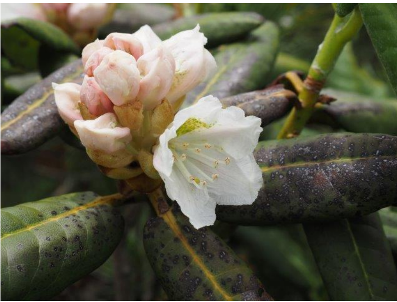
アズマシャクナゲ