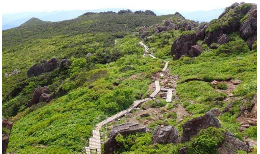
避難小屋手前より 〔左のピークが剣ヶ峰〕