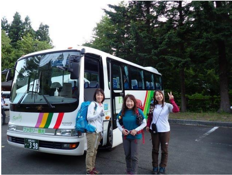
岳バス停 シャトルバス