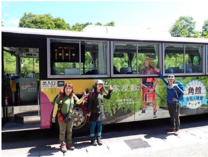
アルパこまくさよりバスに乗車