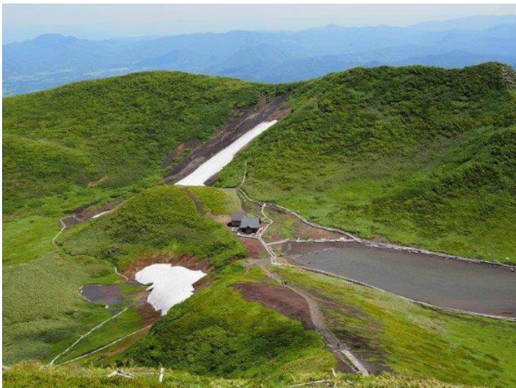
男女岳より阿弥陀池を望む 〔左のなだらかなピークが横岳〕