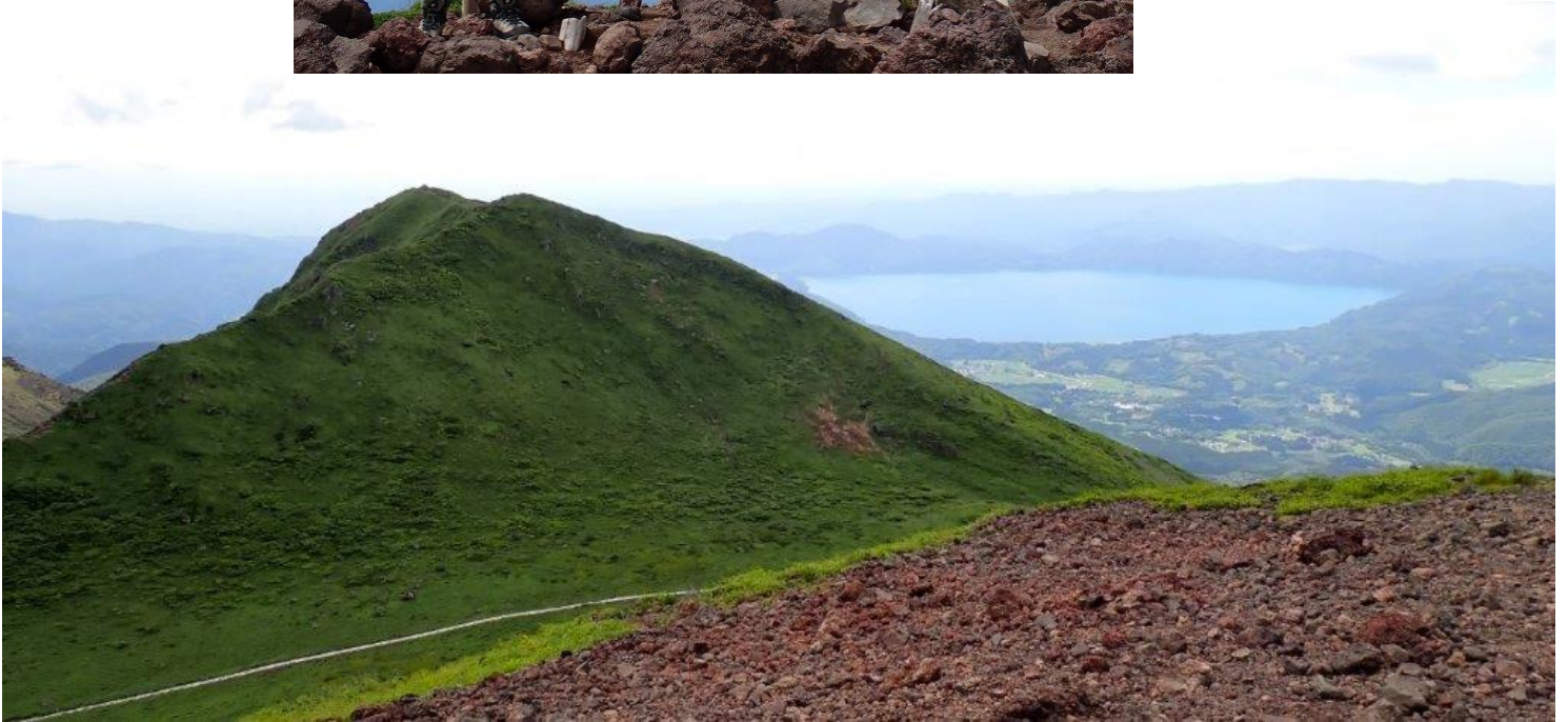
男女岳 山頂より〔男岳と田沢湖を望む〕