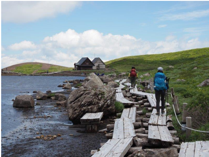
前方 阿弥陀池避難小屋