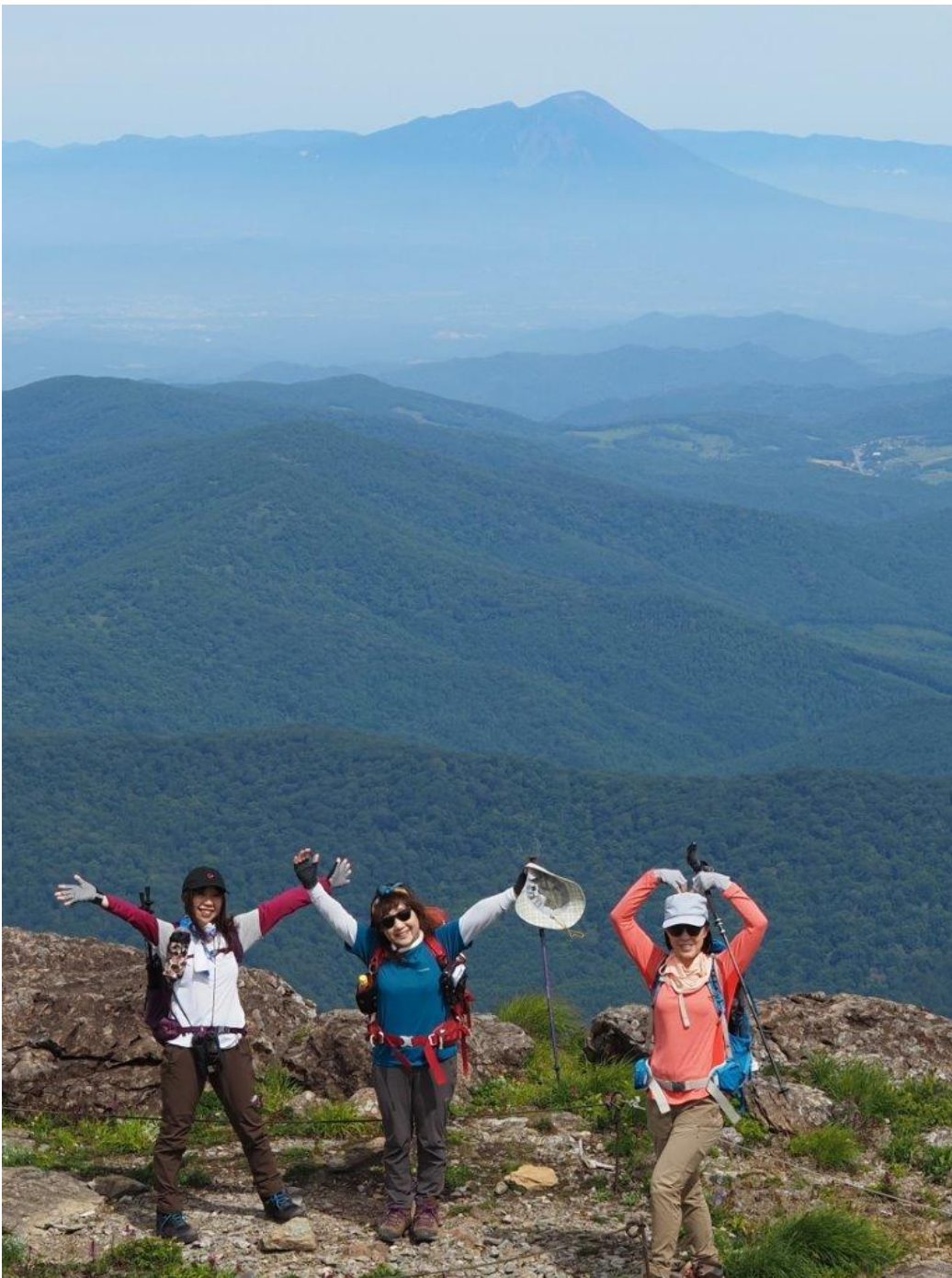
早池峰山 山頂付近にて 〔後方 岩手山を望む〕