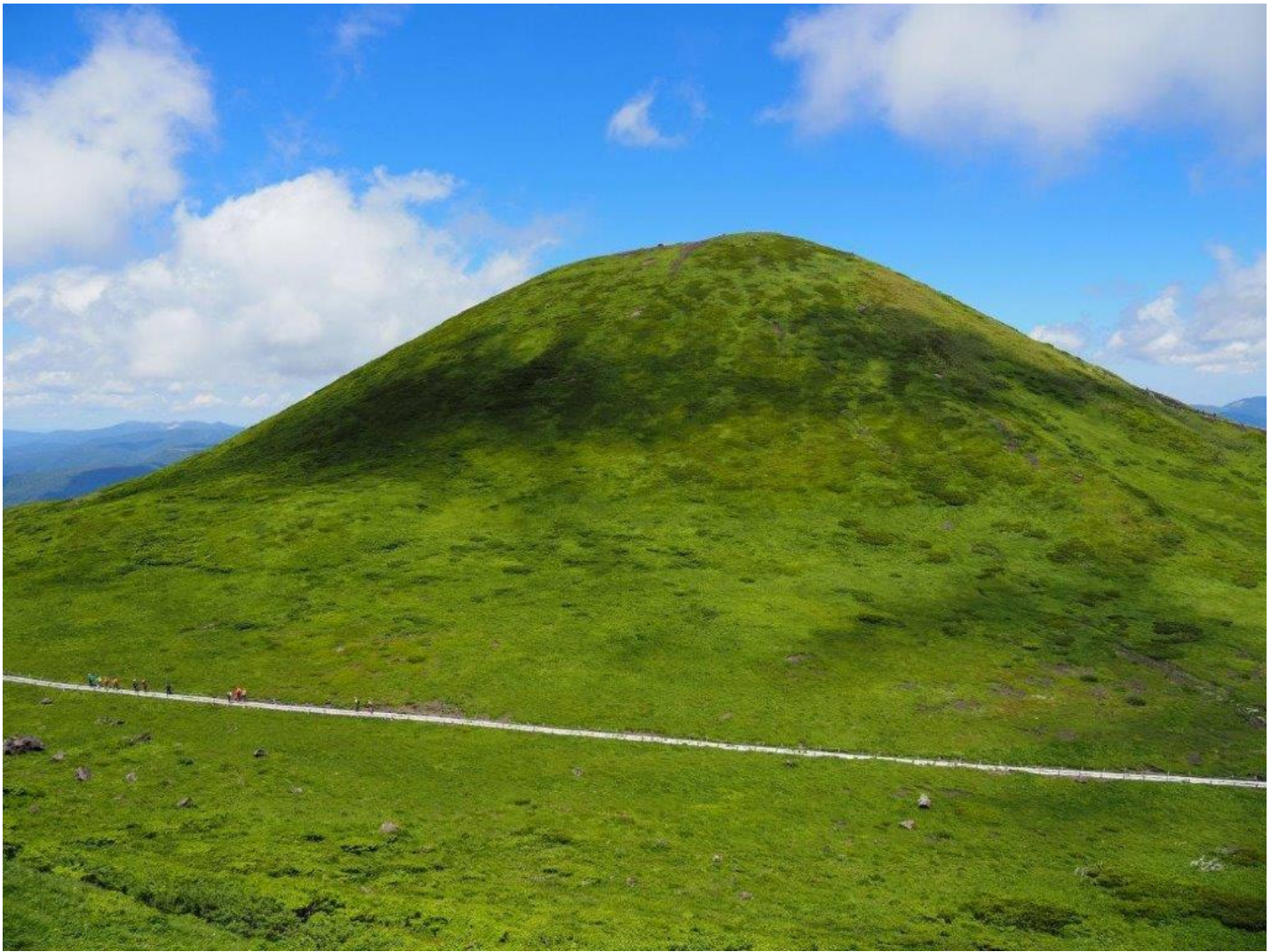
男岳より男女岳を望む