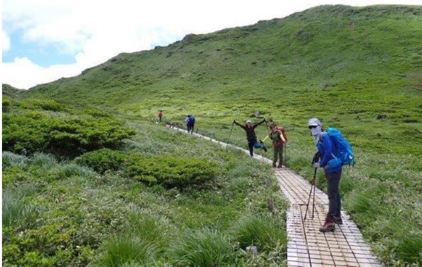
この先が 阿弥陀池