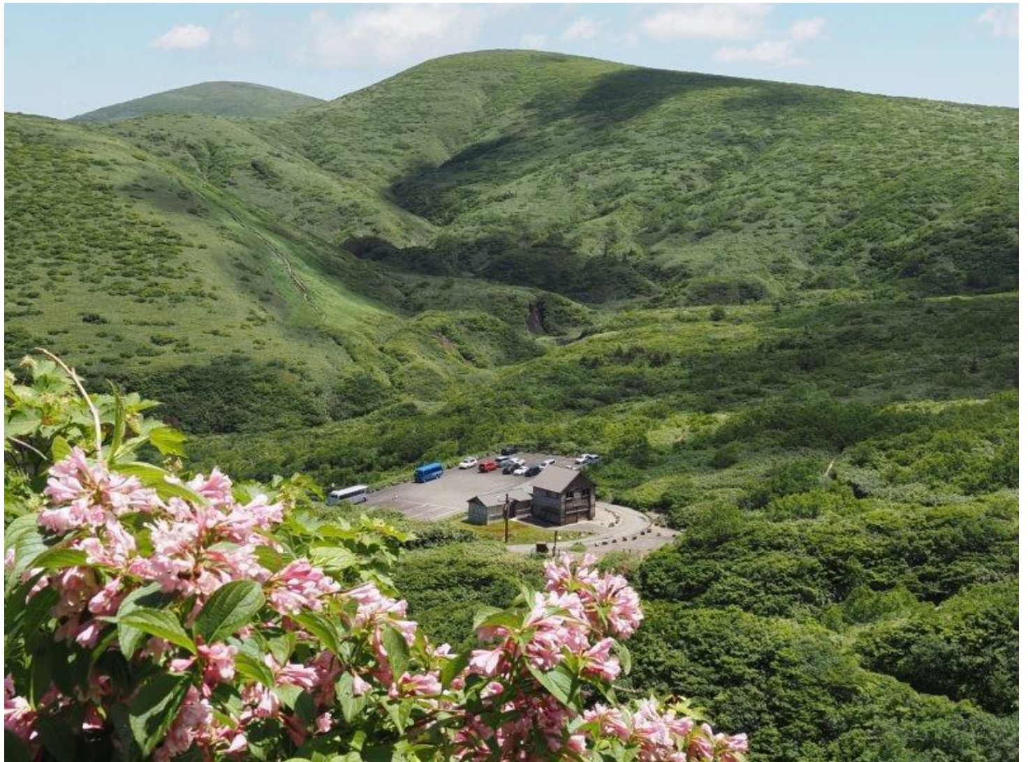
八合目駐車場と避難小屋