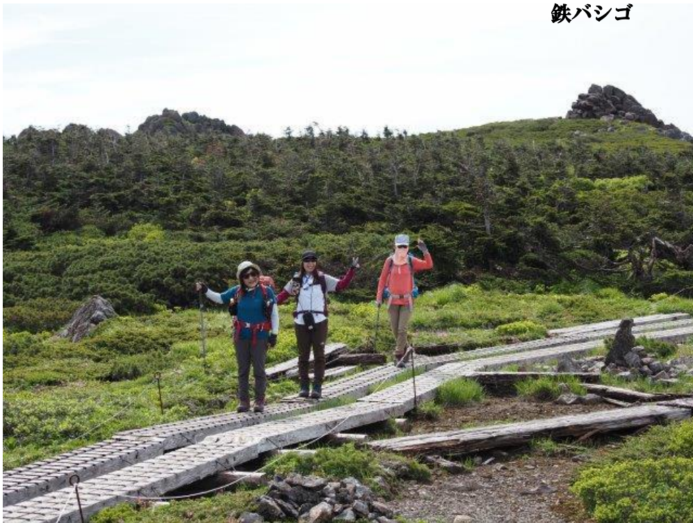
剣ヶ峰分岐より山頂までの木道