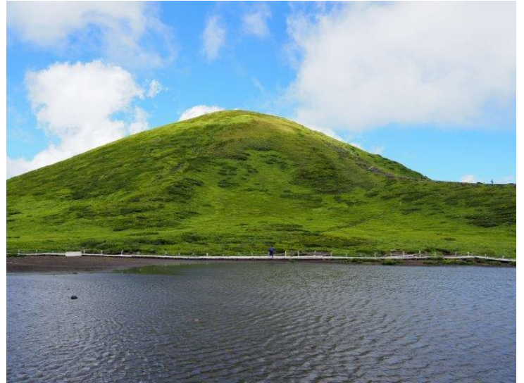
阿弥陀池と男女岳