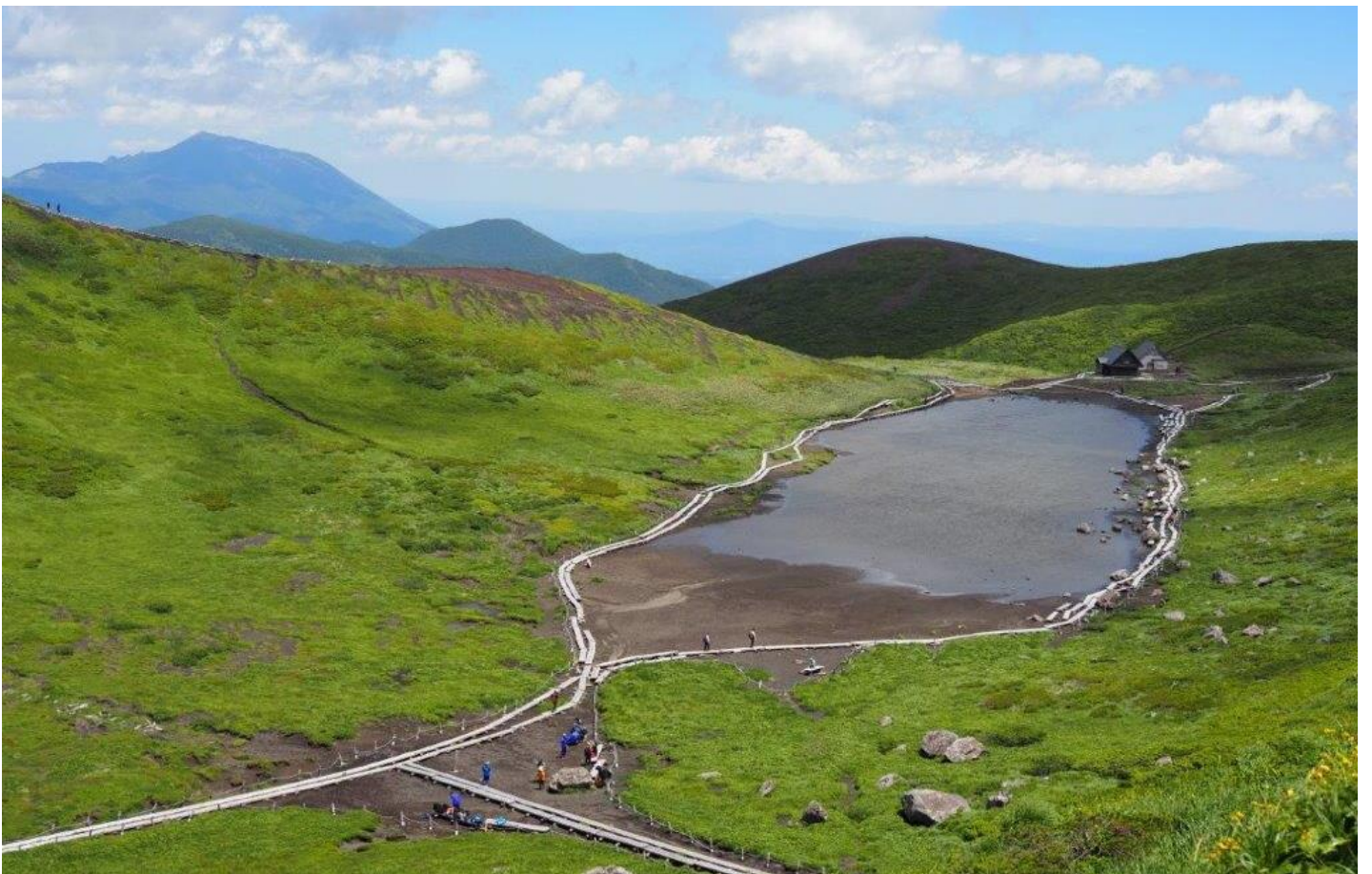
男岳より阿弥陀池を望む〔左前方 岩手山〕