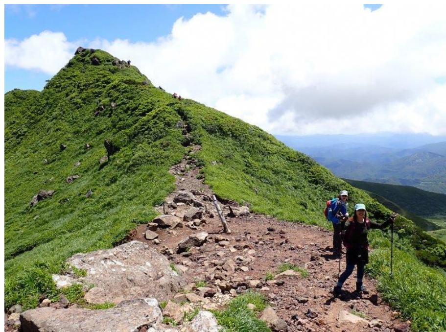
男岳分岐〔後方 馬の背〕