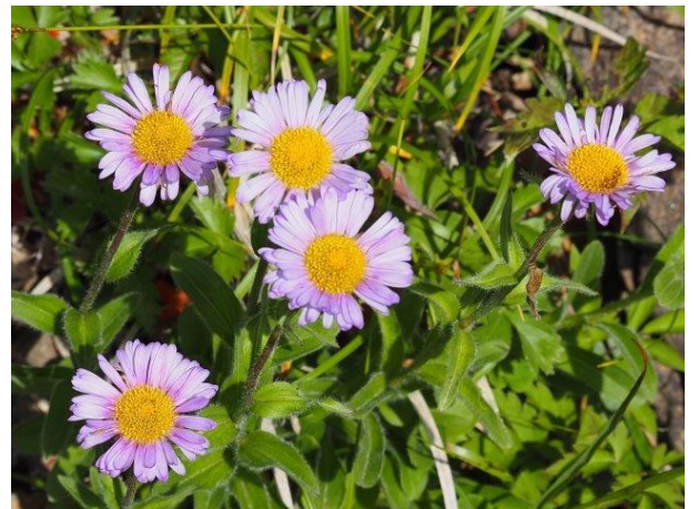
ミヤマアズマギク