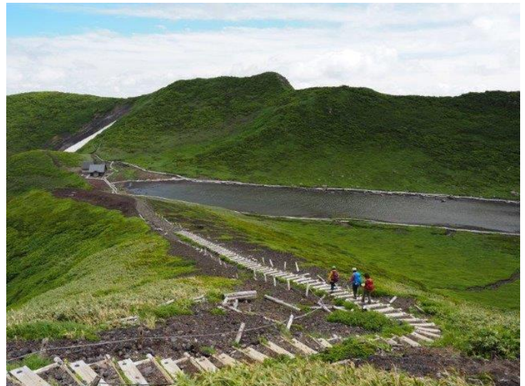
男女岳より阿弥陀小屋へ向かう