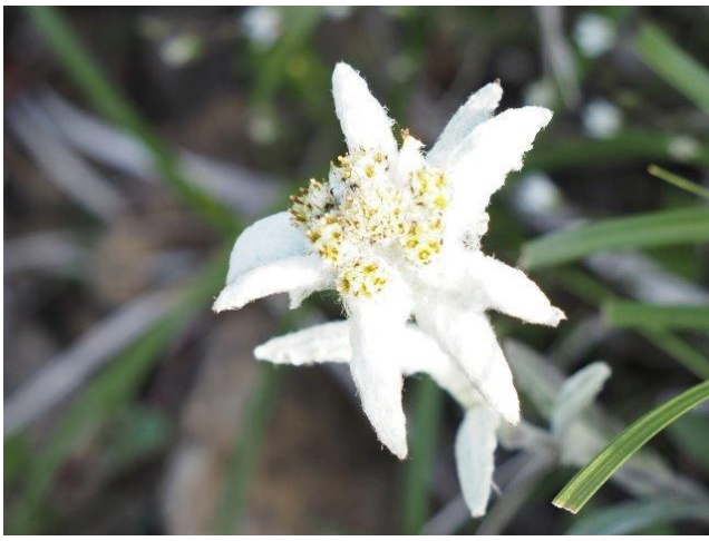
ハヤチネウスユキソウ