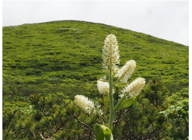
コバイケソウ 後方 男女岳