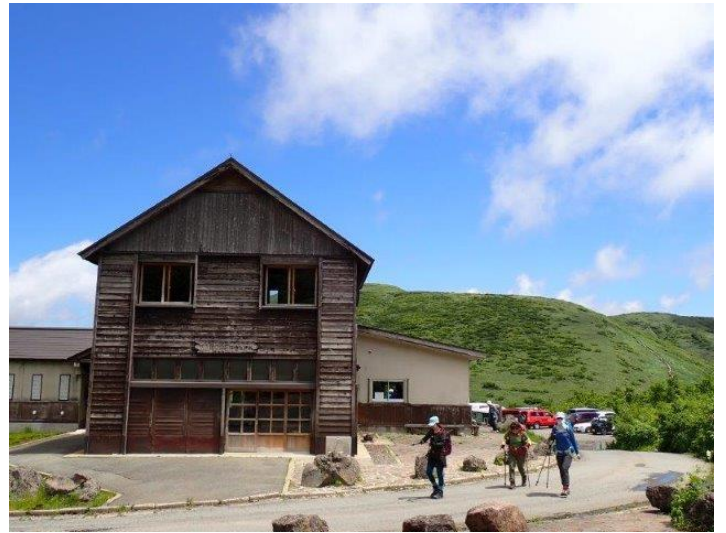
八合目避難小屋出発