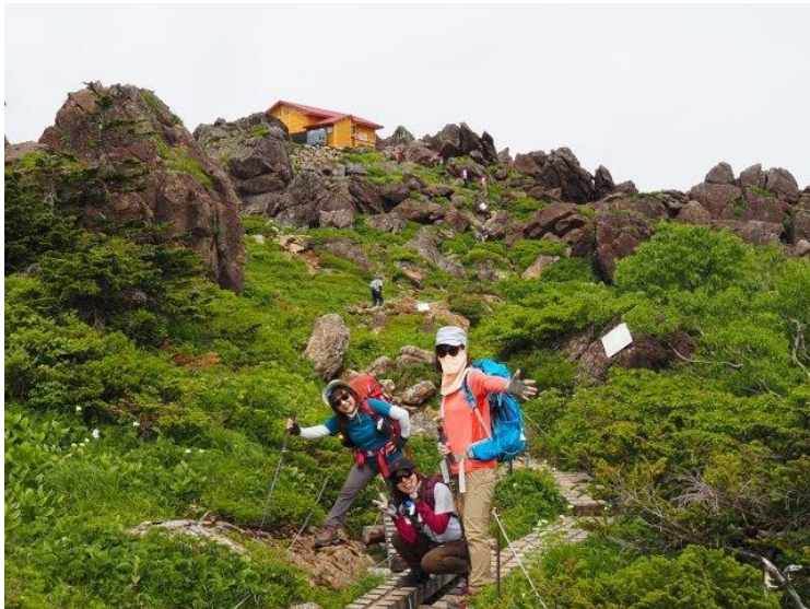
前方 山頂避難小屋