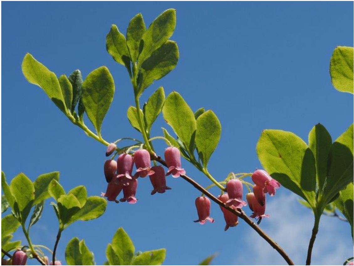
ウラジロヨウラク