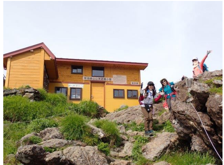
早池峰山山頂避難小屋

写真を撮りながら2時間20分ほどで剣ヶ峰の分岐に到着。 そこから山頂までの木道沿いは、さらに多くの花が咲き乱れていました。 山頂避難小屋すぐ上の早池峰神社奥宮が山頂で、2時間45分で到着。 山頂でゆっくりして、剣ヶ峰を往復して下山。