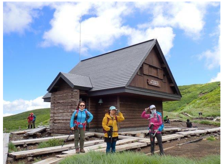
阿弥陀池避難小屋