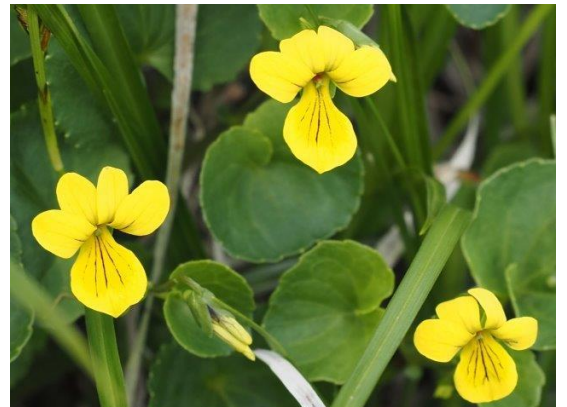
キバナノコマノツメ