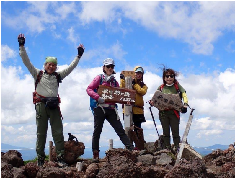
男女（おなめ）岳 山頂