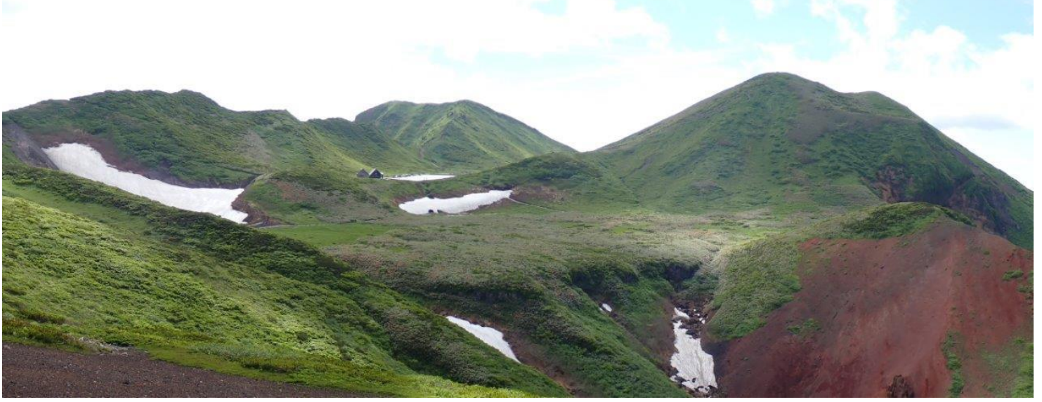
焼森より 中央 男岳・右 男女岳