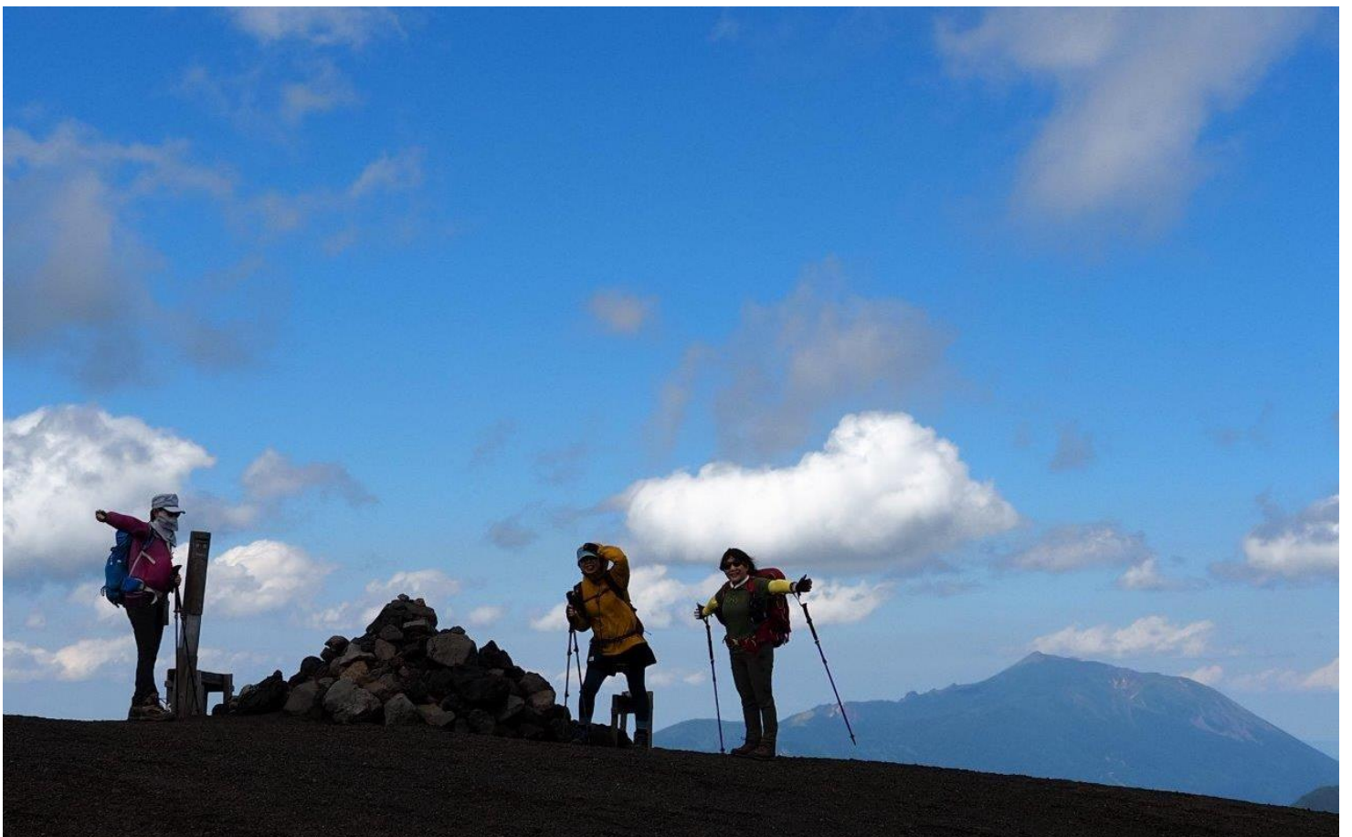
焼森〔右後方 岩手山〕