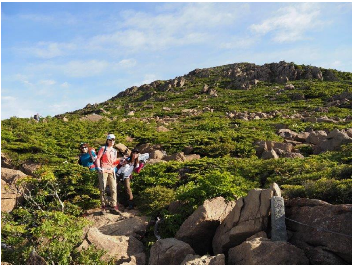
右わきに一合目の標柱