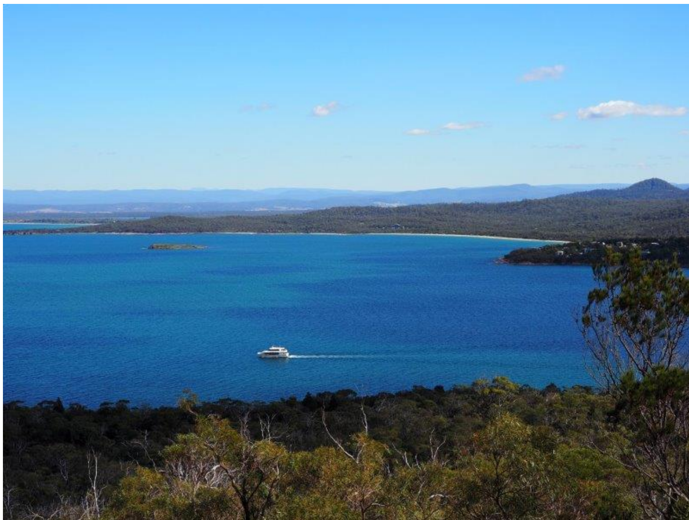
コールズ湾 (Coles Bay) とミュアズビーチ (Muirs Beach) を望む

岩陵の登りで振り返ると、眼下にコールズ湾の真っ青な海とミュアズビーチが望め素晴らしい。