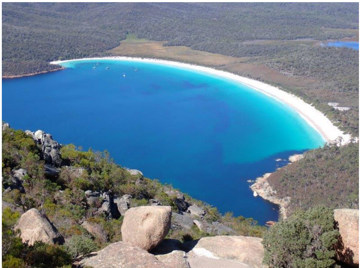
ワイングラスベイ (Wineglass Bay)