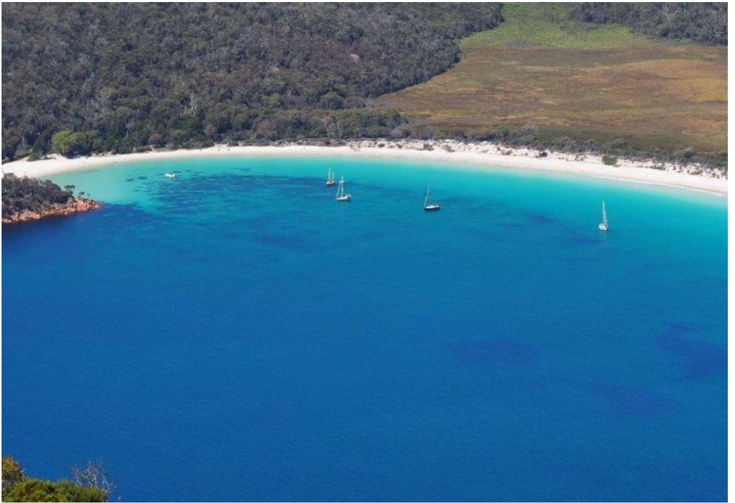
ワイングラスベイ [望遠]