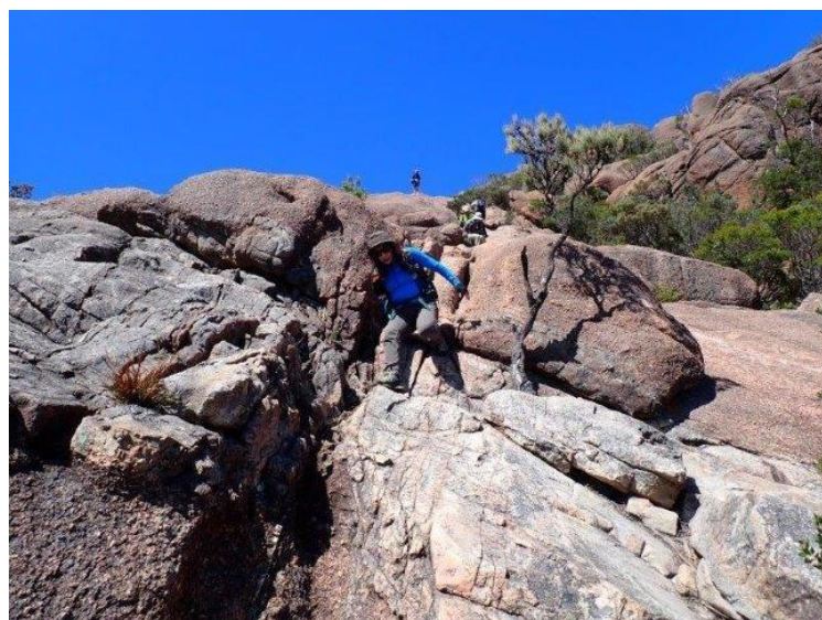
花崗岩でフリークッションが良く効き、快適に素晴らしい景色の海岸線を眺めながらの下山である。