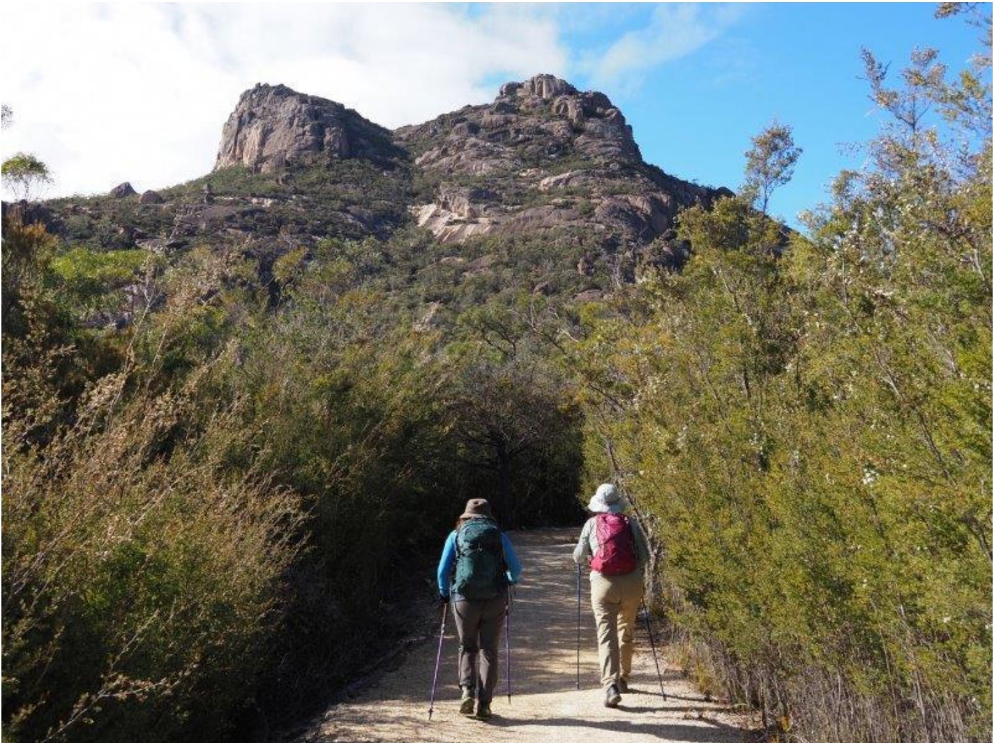
登山口から誤って別のルートに行ってしまう、戻る途中前方のエイモス山