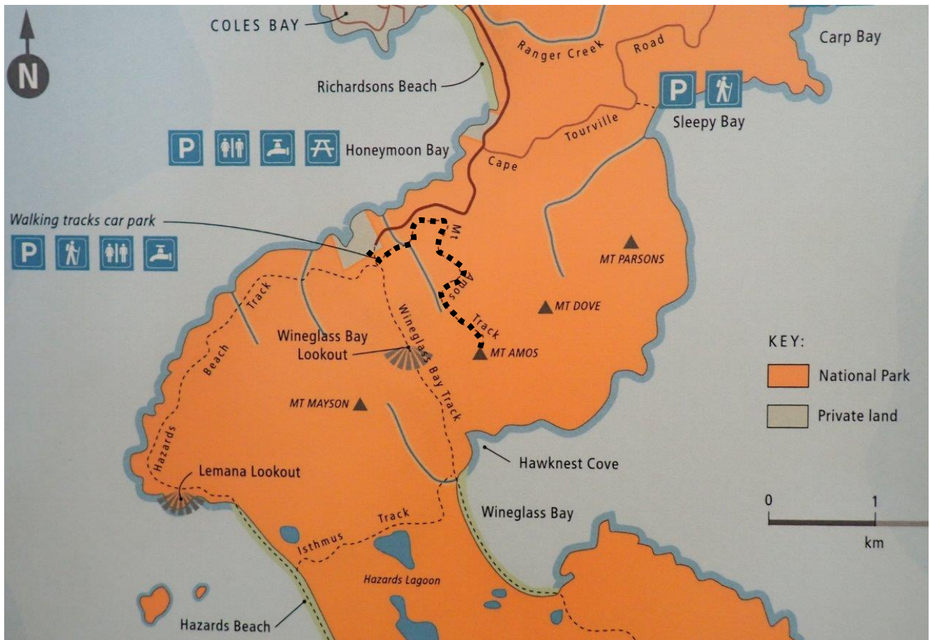
掲示物より（我々が登ったコース .....）

気候も良く風もなく、素晴らしい晴天で、しばらく山頂でゆっくりして下山するのが惜しくなる感じで、まだゆっくりしておきたい気分であった。