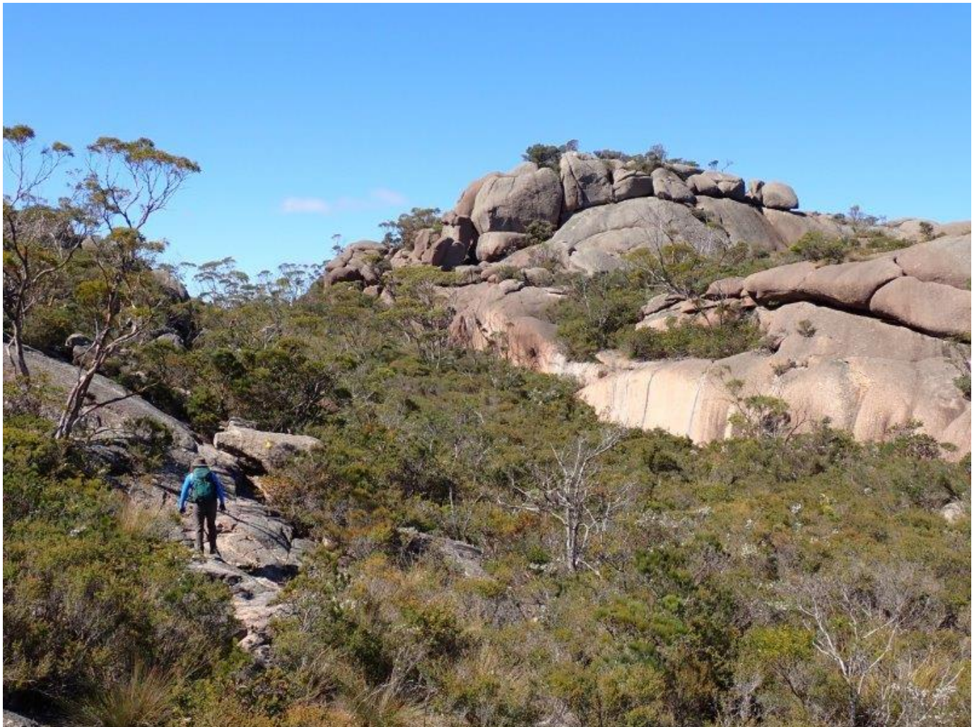
右の岩峰がエイモス山 頂上