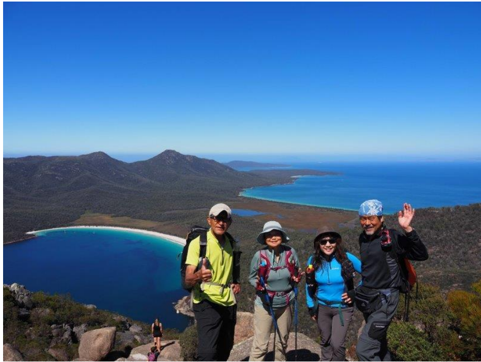
エイモス山 山頂 〔454m〕

山頂からのワイングラスベイは、白い海岸線に真っ青な海が相まってさらに素晴らしい眺望を見ることができた。