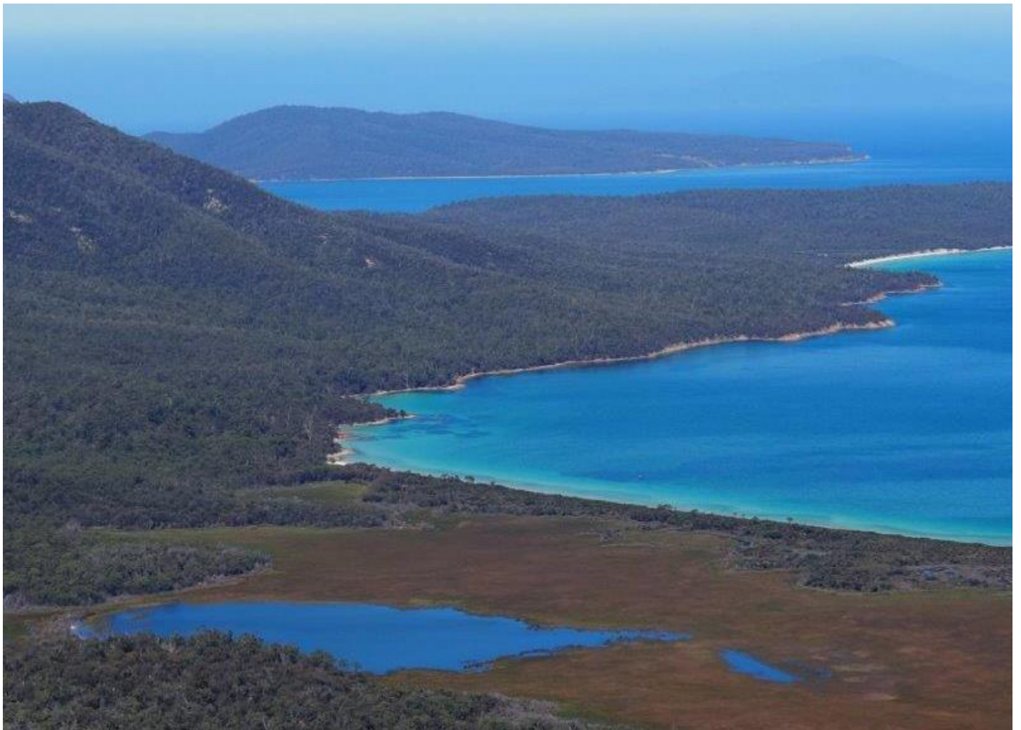
プロミス湾 (Promise Bay) [望遠]